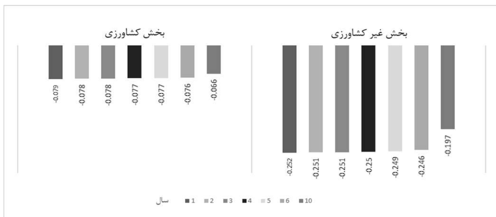
نمودار ۲- تأثیر بخش کشاورزی و غیرکشاورزی بر تغییر نرخ وابستگی به واردات طی هفت سناریو حذف یارانه نان (درصد).